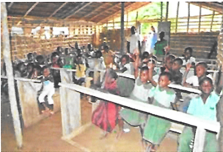
CLASSE AU CAMEROUN