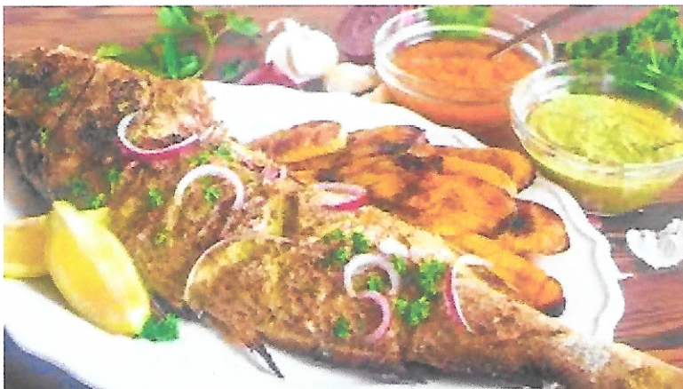
PLAT TYPIQUE DU CAMEROUN