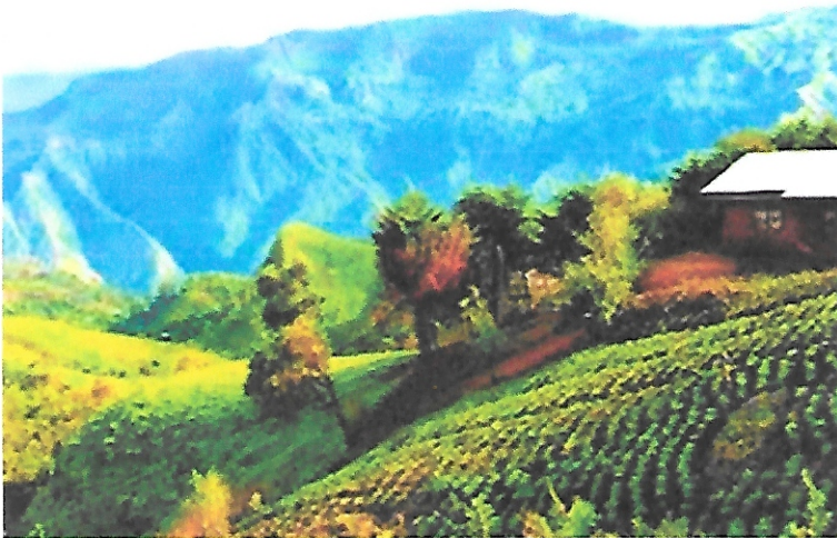
PAYSAGE DU CAMEROUN